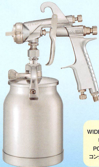
WIDER2-20R2S 吸上式 PCL-10B-3 コンテナ取付例