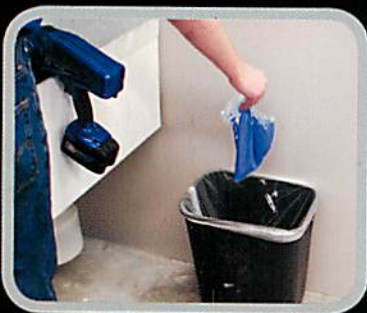
1. 使い捨てのカップライナーを捨てます。

洗浄が簡単な使い捨てカップライナーです。ライナーをカップから外して捨てます。カップに水または洗浄液を注ぎ、ポンプ内で循環させて流せば、次の作業に取り掛かることができます。