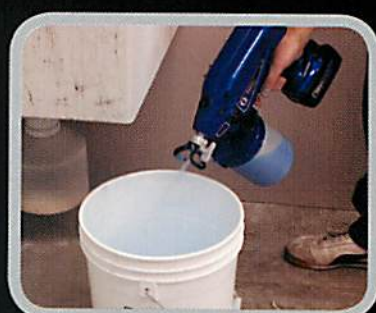
3. チップを逆にして勢いよく流します。