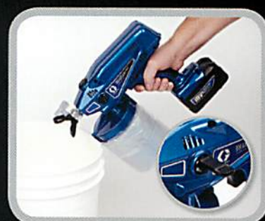
3. スプレーヤーをプライムします。

洗浄が簡単な使い捨てカップライナーです。ライナーをカップから外して捨てます。カップに水または洗浄液を注ぎ、ポンプ内で循環させて流せば、次の作業に取り掛かることができます。