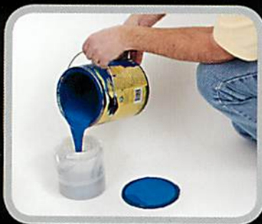
1. 塗料をカップに注ぎます。