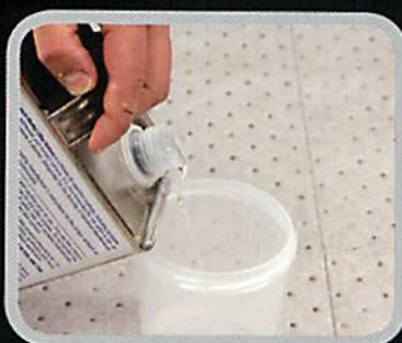
2. カップに水または洗浄液を注ぎます。