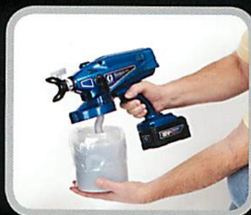
2. カップをスプレーヤーに取り付けます。