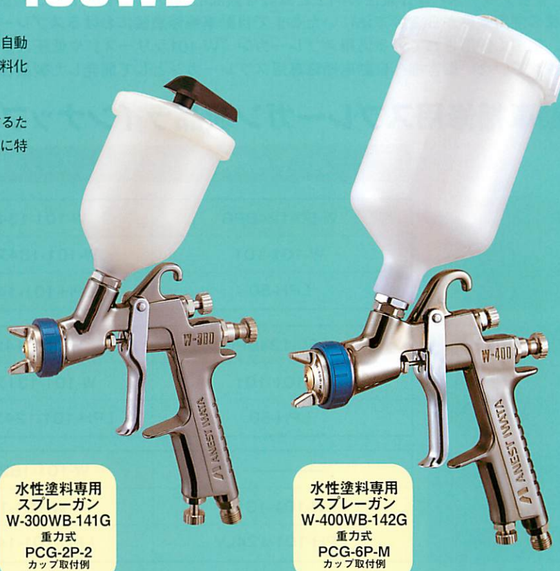
水性塗料専用 スプレーガン W-300WB-141G 重力式 PCG-2P-2 カップ取付例