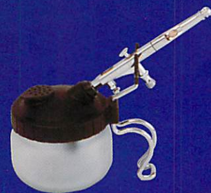
HPA-ACP クリーニングポット