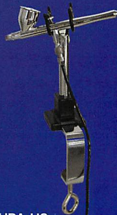
HPA-H2 エアブラシハンガー

HPA-MGF ミニグリップフィルタ ホース内のホコリや水分 の除去に効果的。使いや すいグリップタイプ