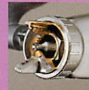
新塗料ノズル機構 (特許取得済第 3359771号 LPH-300/400LV)