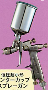
低圧超小形 センターカップ スプレーガン LPH-80 重力式 PCG-2D-1 カップ取付例