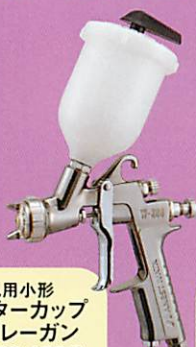
汎用小形 センターカップ スプレーガン W-300-132G 重力式 PCG-2P-2 カップ取付例