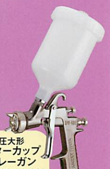
低圧大形 センターカップ スプレーガン LPH-400-144LV 重力式 PCG-6P-M カップ取付例