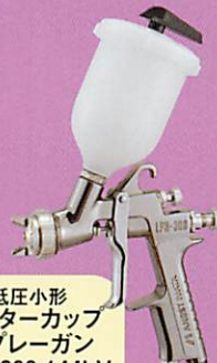
低圧小形 センターカップ スプレーガン LPH-300-144LV 重力式 PCG-2P-2 カップ取付例