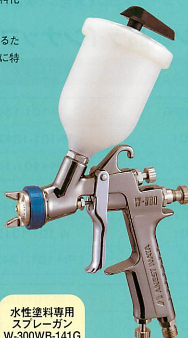
水性塗料専用 スプレーガン W-300WB-141G 重力式 PCG-2P-2 カップ取付例