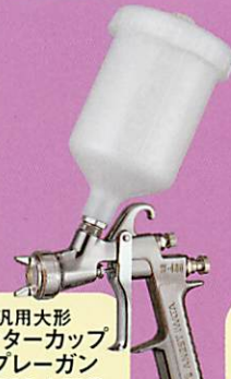
汎用大形 センターカップ スプレーガン W-400-142G 重力式 PCG-6P-M カップ取付例