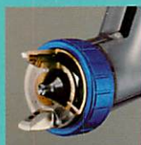
新塗料ノズル機構 (特許取得済第 3359771号 W-300WB/400WB)

世界各国の塗料メーカーにより、水性塗料用スプレーガンとしての推奨を頂いております。