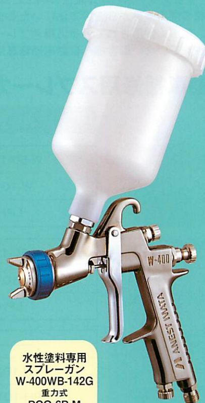
水性塗料専用 スプレーガン W-400WB-142G 重力式 PCG-6P-M カップ取付例