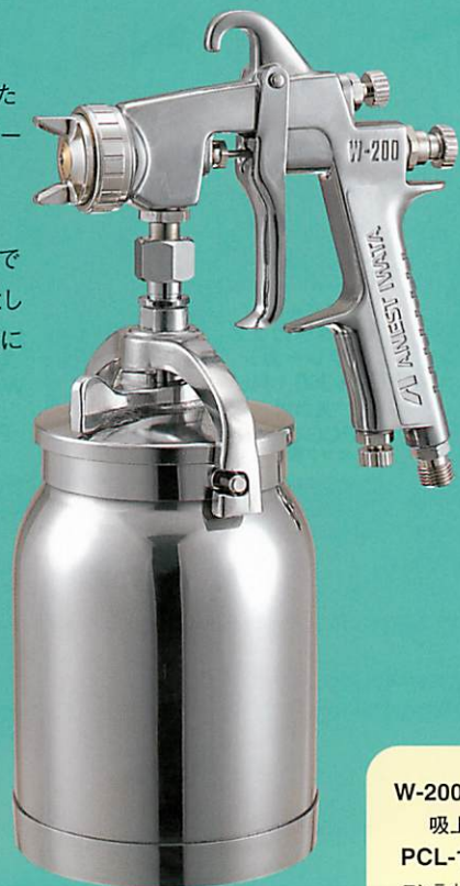
W-200-202S 吸上式 PCL-10B-3 コンテナ取付例